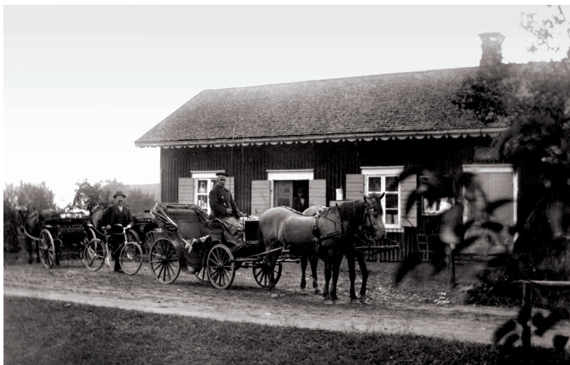
När Östra Emterviks Sparbank hade möte stod många ekipage utanför och väntade.

gott humör, tänker han. Med svidande hjärta skär han av en bit tobak. Själv tycker Schullström att han tagit till en rejäl bit, som han överränner med orden: