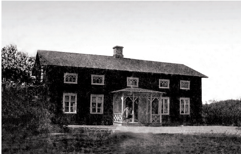
Mangårdbyggnaden på Gärde i Prästbol. Huset är sedan länge borta.

Här har han ätit många mål mat och druckit många koppar kaffe. Det är alltså inte blyghet och främlingskänsla som gör att han står obeslutsam, utan han kanske en intuitiv känsla av att hans besök kommer olägligt.