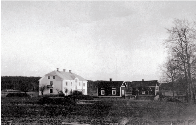
Ålderdomshemmet i Gunnerud.