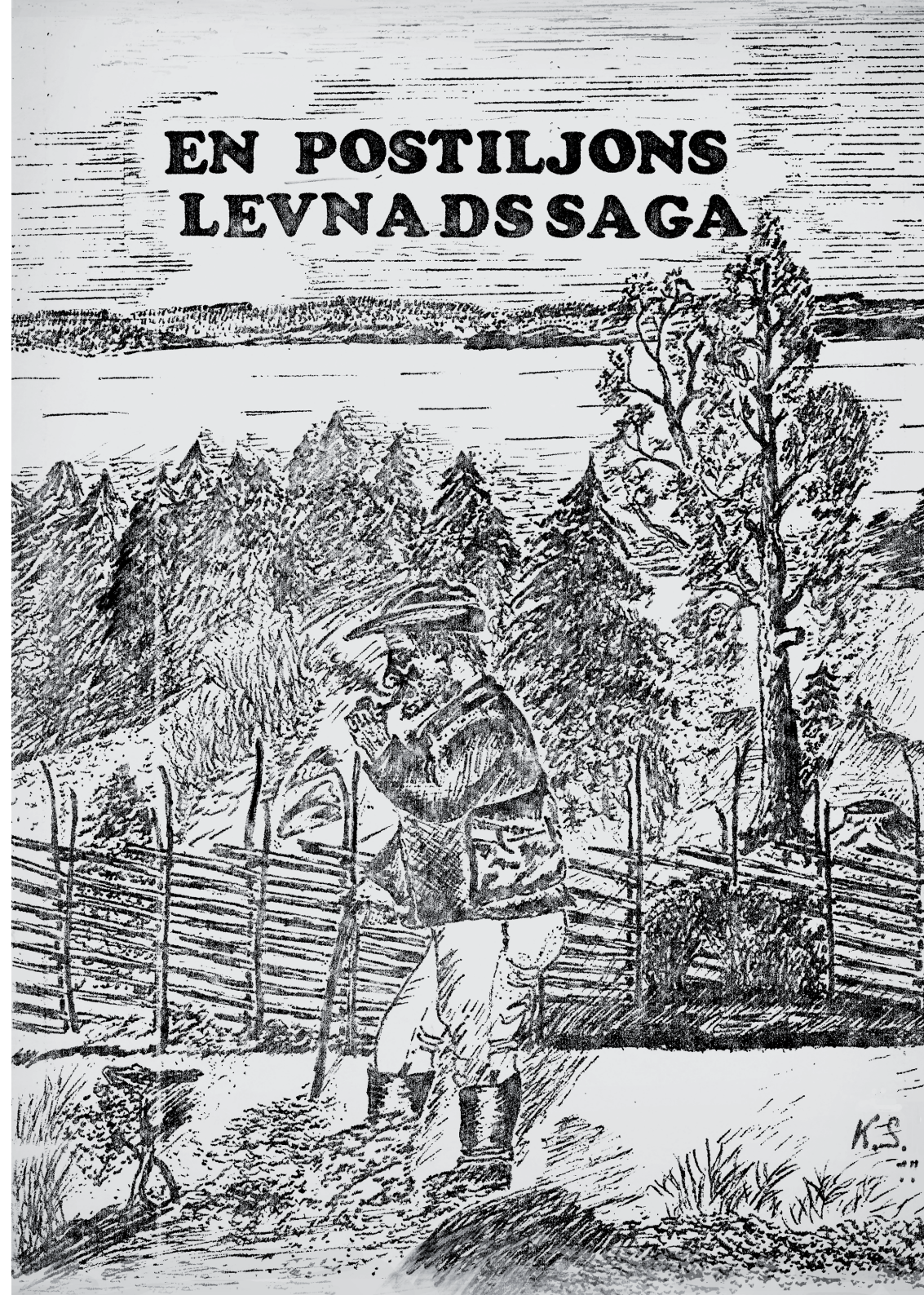
Illustration Karl Sandin