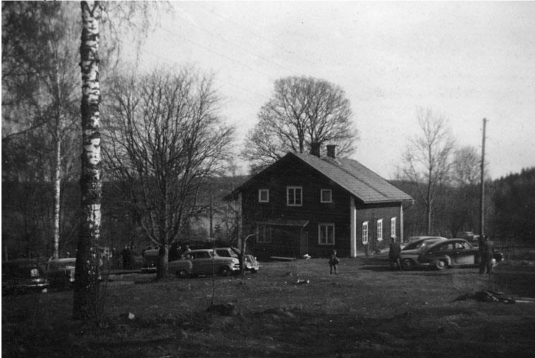
Bild från auktionen 1961

Gården 1:2 (Senare 2:1, 3:18) omfattade från början 2/16 mtl, dvs hälften av hela hemmanet, 120 skatteören.